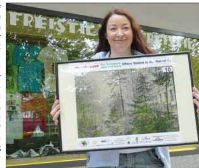
Historische Parkmotive in der Magistrale.